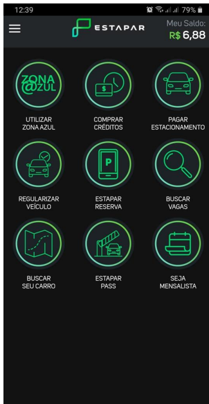
App Vaga Inteligente